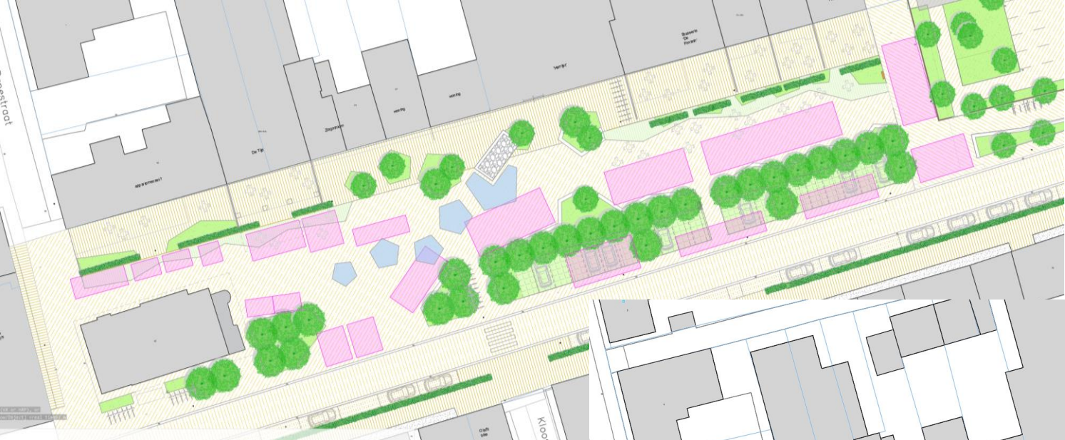
Opstelling markt in combinatiemodel