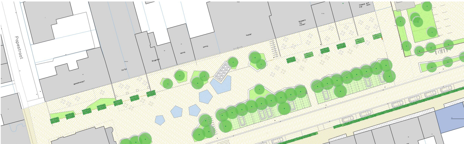
vertaald naar onze situatie