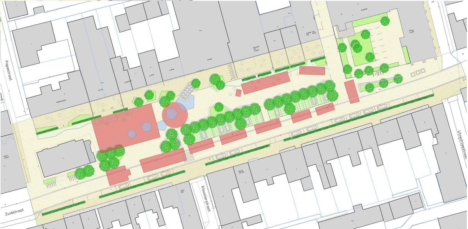
Opstelling kermis in combinatiemodel: afsluiting Zuidstraat (verkeersomleiding noodzakelijk)