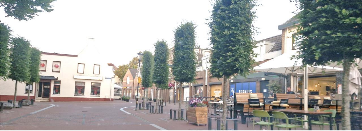
leibomen om de 4-5m