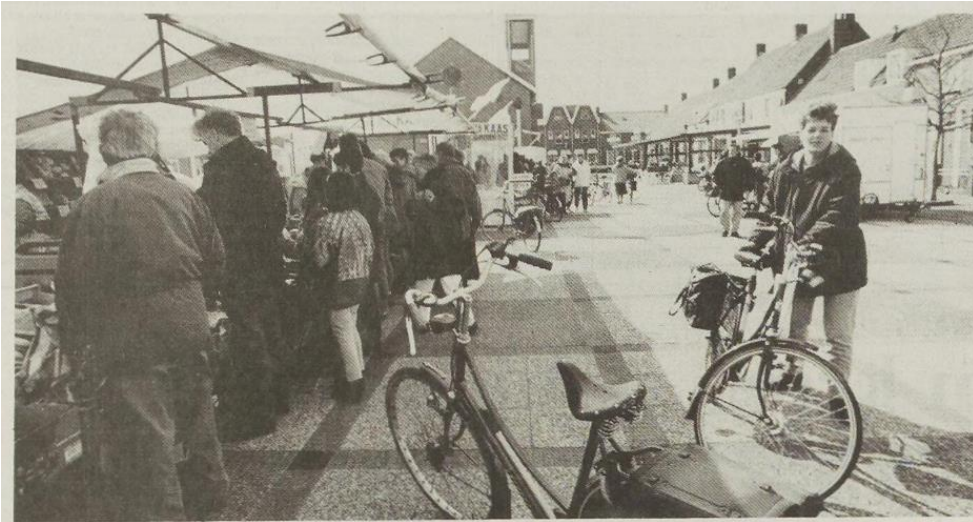
Door de herinrichting van de Markt in Westkapelle wordt de maatverhouding van het plein meer in balans gebracht.