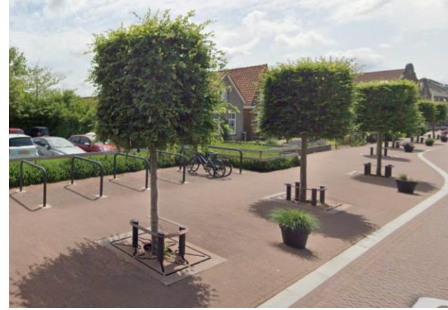
kusbomen om de 6-7m