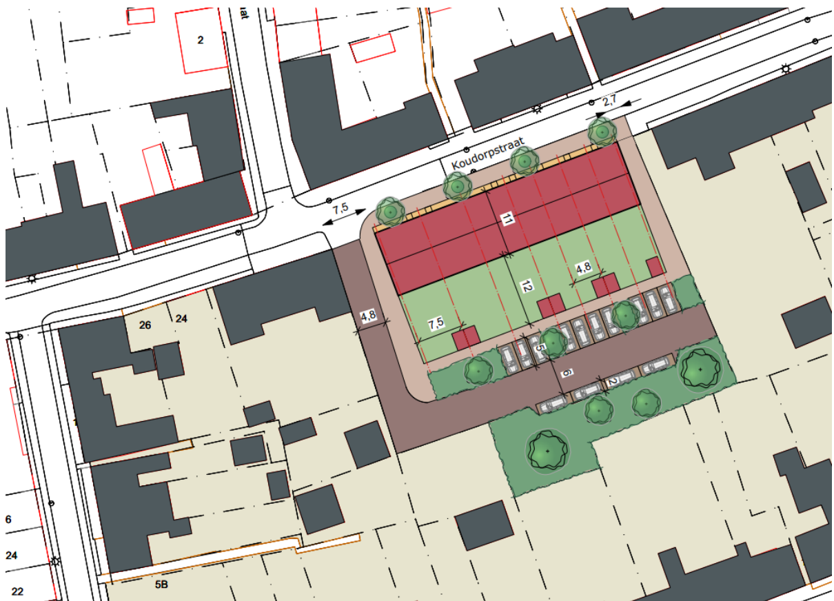
Figuur 3 Woningbouwlocatie Lichtboei (aangepast ontwerp)