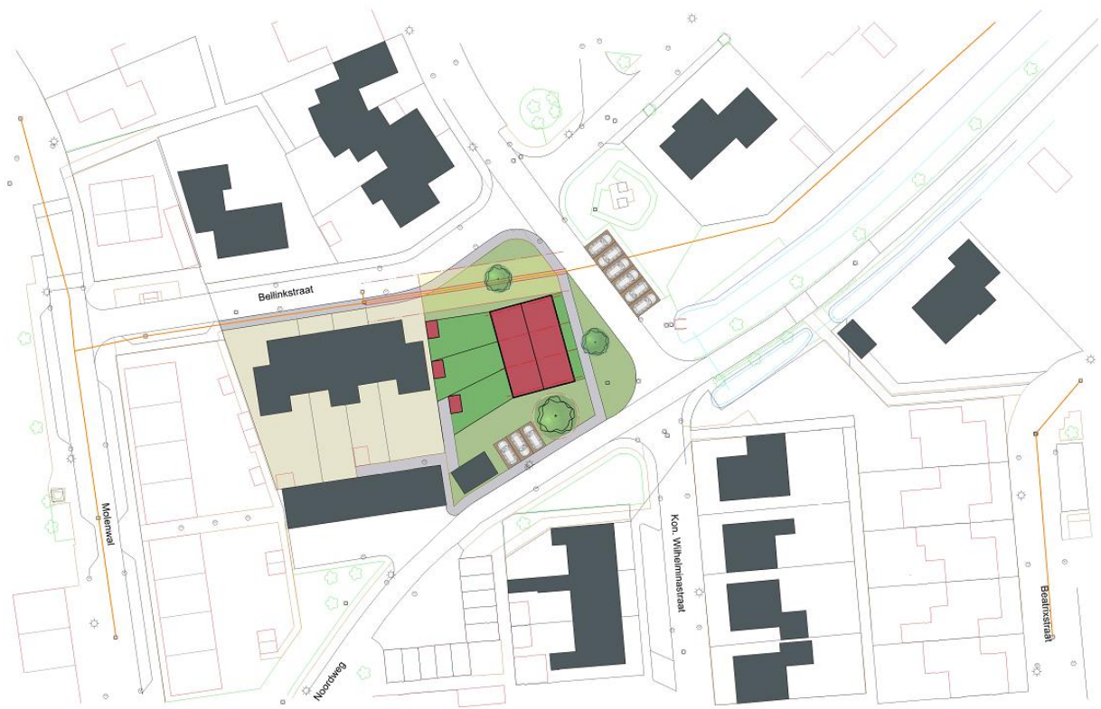
Figuur 1 Woningbouwlocatie Torenlicht (ongewijzigd)