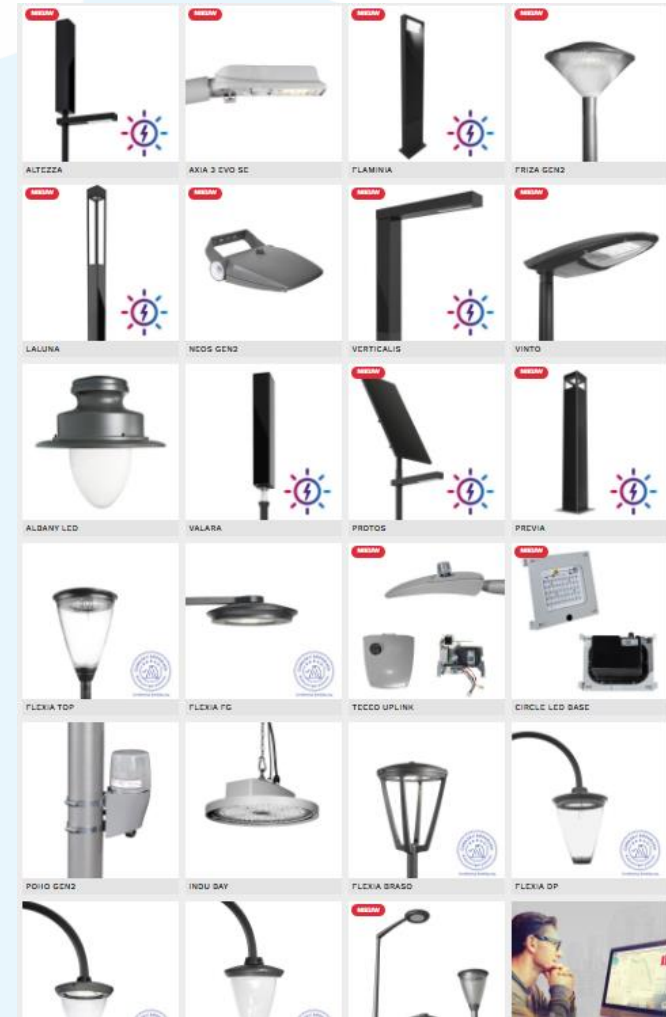
Zeer uitgebreid assortiment